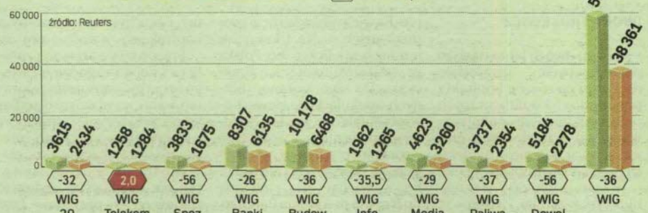
Wartość indeksów w pkt. 17 IX 2007 19 IX 2008 (xxx) zmiana w proc.

Czy to oznacza, że kurs TP będzie rósł w czasie bessy? - Wątpię we wzrost kursu TP SA, natomiast wolniejszy spadek jej kursu w czasie bessy jest bardzo prawdopodobny - twierdzi Paweł Puchalski, analityk Domu Maklerskiego BZ WBK.